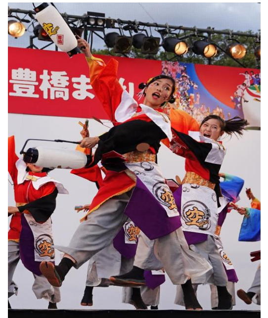
第65回グランプリ 「躍動」